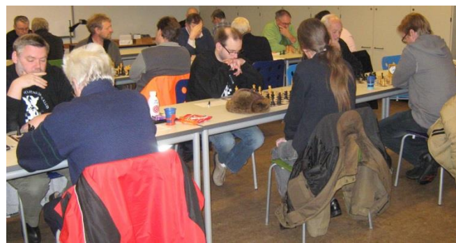
Holdturneringskampe i Vojens 31-01-2013

1. e4 c5 2. Lb5 a6 3. Le2 Sc6 4. c3 Sf6 5. Dc2 d5 6. exd5 Dxd5 7. Lf3 De6+ 8. Se2 Se5 9. Sf4 Sxf3+ Hovsa. Det er en dobbeltskak! Hvid opgav.